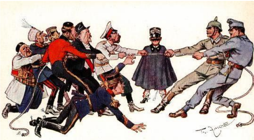
Cartel de propaganda de 1914 que hace alusión al “equilibrio” europeo.

hacer comprensible el presente con base en el estudio crítico de las fuentes que utiliza, en la deducción y en la organización de los objetos estudiados, es decir, más que inventivo es un arte imaginativo.